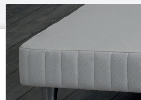
Finition bords droits